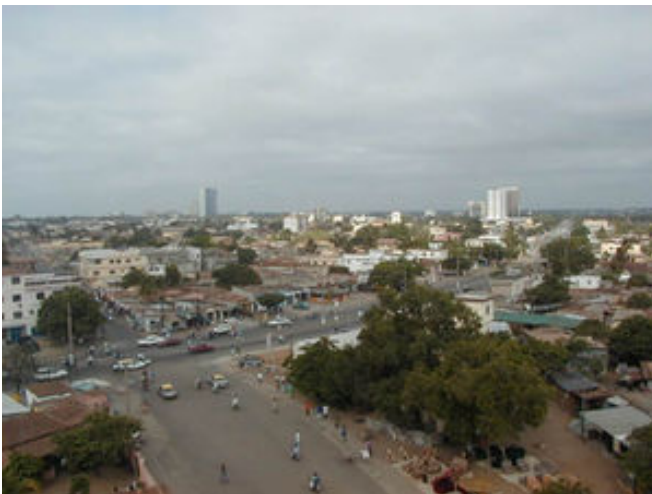
Vue de la ville de Lomé