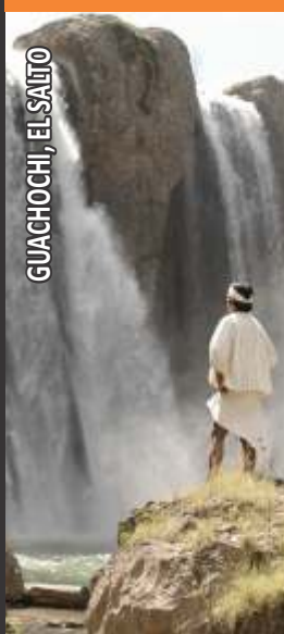
GUACHOCHI, EL SALTO