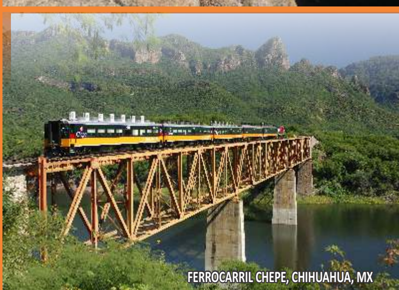
FERROCARRIL CHEPE, CHIHUAHUA, MX