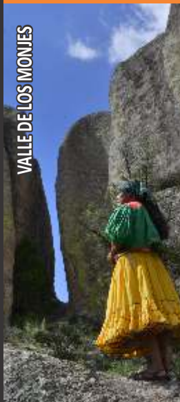
VALLE DE LOS MONJES