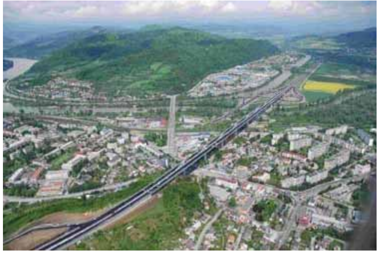
Autoroute D1 Sverepec-Vrtizer, cofinancée par les fonds de cohésion européens

La Conférence routière 2010 , parrainée par le Ministère du Transport, organisée par la Société routière slovaque, centrée sur la politique technique et de gestion des routes et les problèmes de législation, le développement et la modernisation du réseau routier, le financement de la construction, de l'entretien et de l'exploitation des routes, la mise en œuvre des projets PPP (DBFO), l'expérience dans l'introduction de systèmes de péage électronique au 1er janvier 2010, la nouvelle loi sur les Routes et le Système national d'information trafic développé et cofinancé par des fonds de l'UE s'est tenue du 25 au 26 mars 2010 à Bratislava.