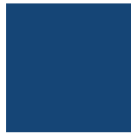
Bleu / Blue