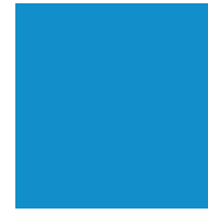
Bleu 1 / Blue 1