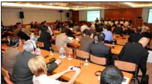
Séminaire du CT A3 à Budapest, mai 2009

Vingt-cinq séminaires internationaux de l'AIPCR ont été organisés durant la période 2004-2007, dont trois conjointement par plusieurs comités techniques.