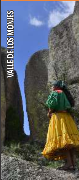
VALLE DE LOS MONJES