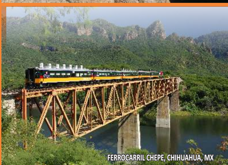
FERROCARRIL CHEPE, CHIHUAHUA, MX