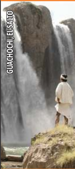
GUACHOCHI, EL SALTO