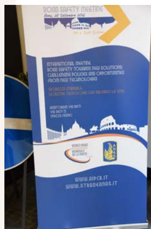
Logo de la reunión internacional

Para afrontar el reto de la Seguridad Vial, más que reprimir, es necesario evitar comportamientos de riesgo, y también realizar mayores inversiones en investigación tecnológica. La tendencia internacional más común apunta a tecnologías capaces de prevenir los accidentes en la carretera y sus consecuencias y, cada vez más, a fomentar un